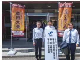
中国ブロック YEG 春の会長会議参加者